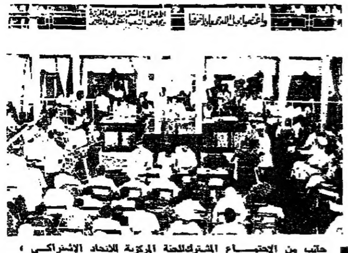
جانب من الاجتماع المشترك للجنة المركزية للتحالف الاشتراكي ومجلس الشعب، ومجلس الشعب الاشتراكي في الخرطوم

الخرطوم - من فؤاد عباس جند الشعب السوداني 3 ممثلي تحالف قوى الشعب العامل، وتيديد وولاه للرئيس جعفر نوري، وذلك في الاجتماع المشترك الذي عقد في قاعة مجلس الشعب بالخرطوم مساء الجمعة الماضي واستمر حتى بعد منتصف الليل.